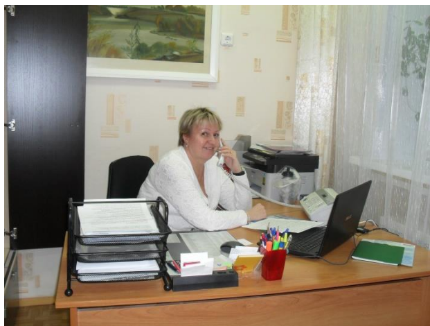
кабинет заведующего ДОО