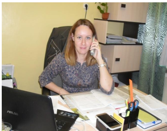
кабинет зам.зав.по АХР